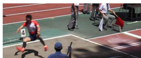
が、まずまずの 結果であった。 足を揃えれば!

今後の予定 *1...陸協、*2...障害別陸連の登録が別途必要です。詳しくは登城まで。